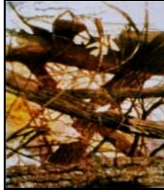
شكل (١) عمل محمد عمرو ٢٠٠٠