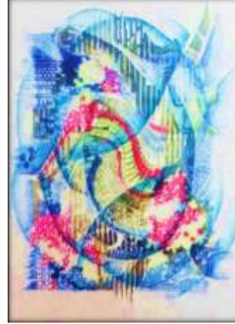
شكل (٣) عمل هبة مازن ٢٠١١