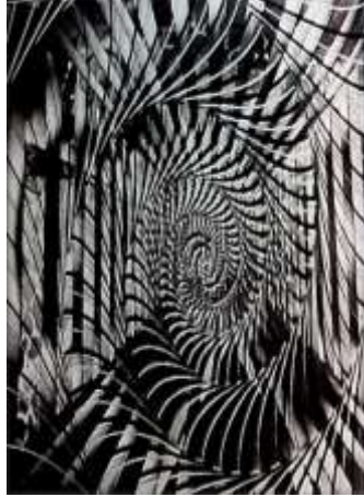
شكل (٤) عائشة عواد ٢٠٠٣